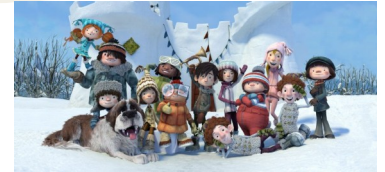
Les super-héros du quotidien !