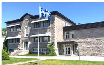
École Sainte-Marie 1120, rue Principale Saint-Marc-des-Carières (Québec) G0A 4B0 epsm@cspportneuf.qc.ca Tél. : 268-3355

Divers moyens ont été utilisés : consultation de données locales et régionales, consultation de personnes-clés, utilisation de questionnaires. Voici un aperçu des résultats.